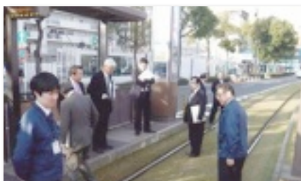
鹿児島市ユートラム（連接式超低床電車）乗車