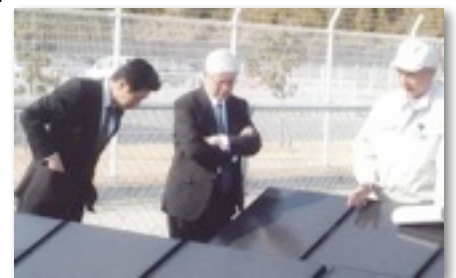
阿賀野市メガソーラーシステム視察