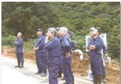
7月豪雨後の十日町市視察