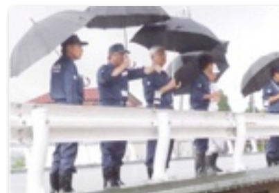
新潟・福島豪雨地視察