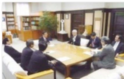
鹿児島市議会訪問