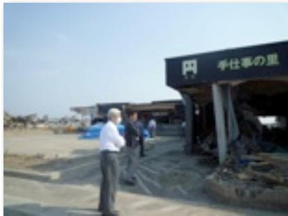
仙台石巻市地区視察