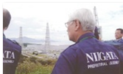
東京電力柏崎刈羽原発視察